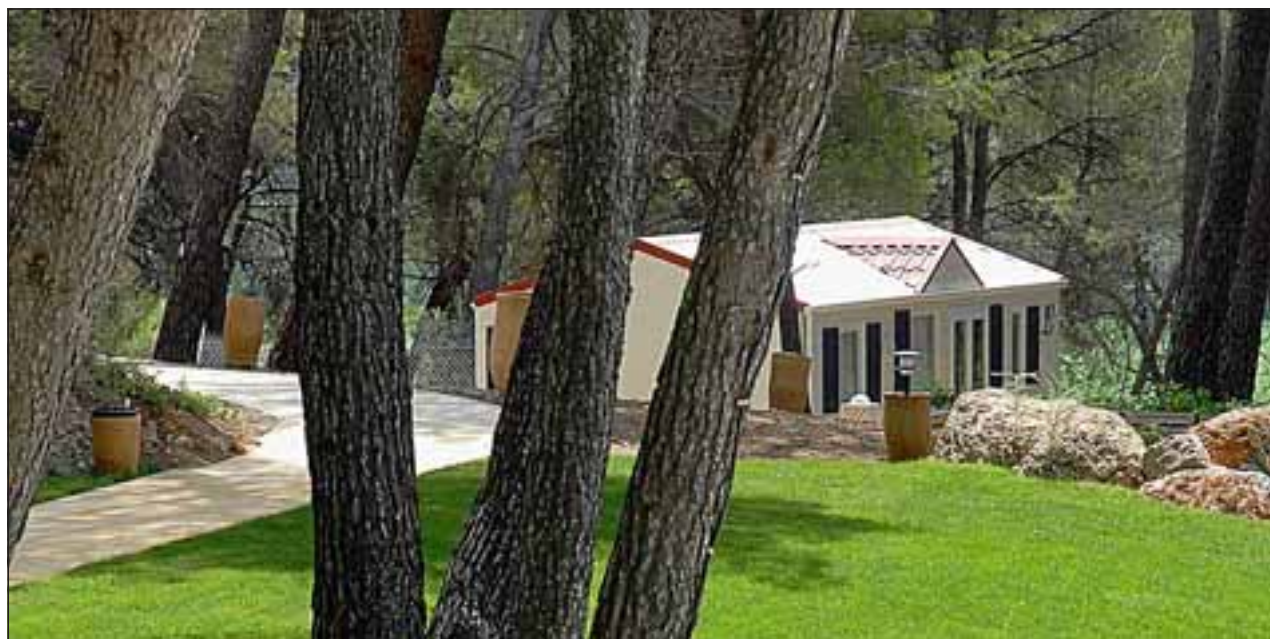
● Calme, nature et luxe : les résidences Louisiane s'intègrent harmonieusement dans l'environnement préservé du camping de la Pinède à Castelnau (34). Une belle carte de visite pour le fabricant breton.