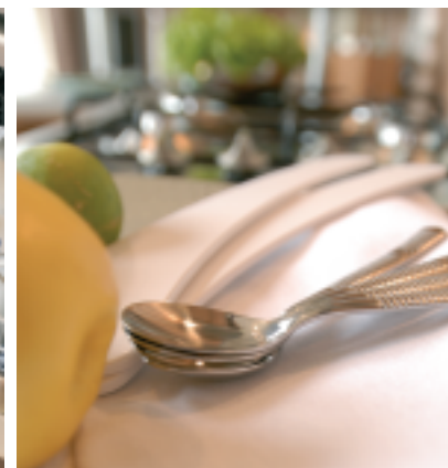
Lave vaisselle en option.